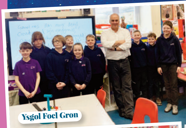
Ysgol Foel Gron